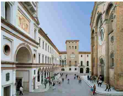
Crema- Piazza Duomo

Gastronomia e cultura ancora insieme: dopo il successo della prima edizione, torna infatti anche quest'anno I Mondì di Carta , la rassegna cultural-gastronomica che si terrà nella suggestiva cornice della città di Crema, nei giorni 10, 11 e 12 ottobre, organizzata dall'Associazione culturale imondidicarta .